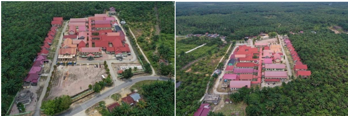
FOTO DAN BATAS WILAYAH RSUD ACEH SINGKIL